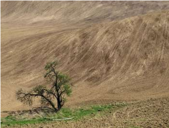
Petr Tomáš - Útok