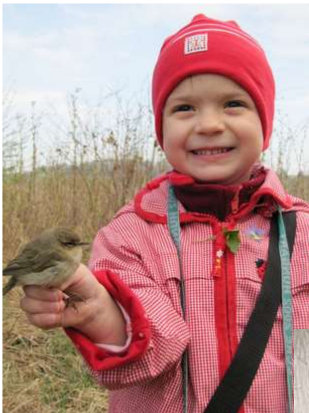
Kroužkování u rybníka u Lusný