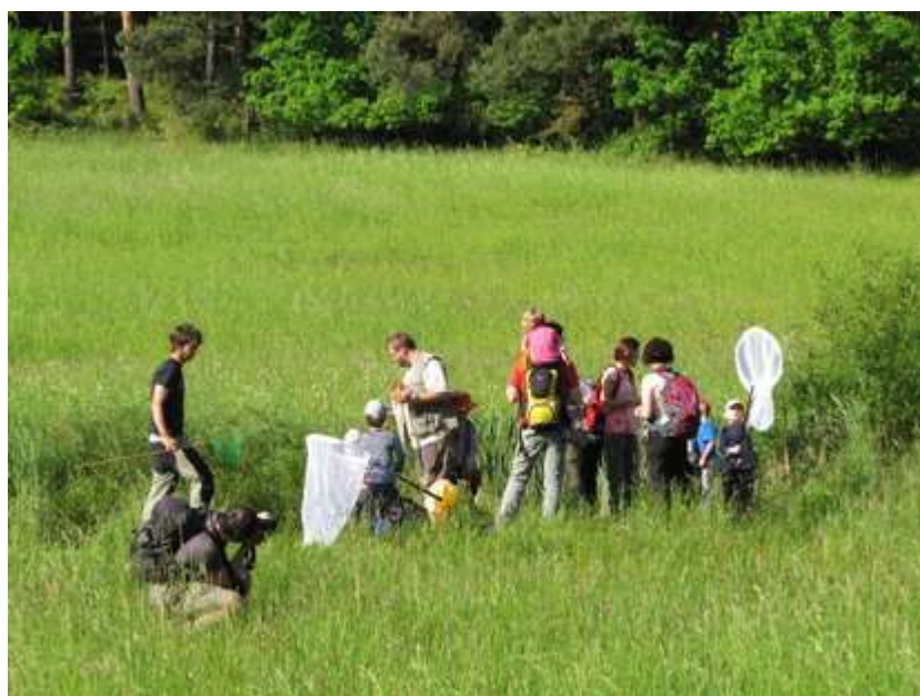
Za obojživelníky do Hradců