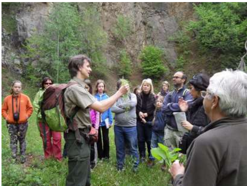
Za jarní květenou do okolí Vidova