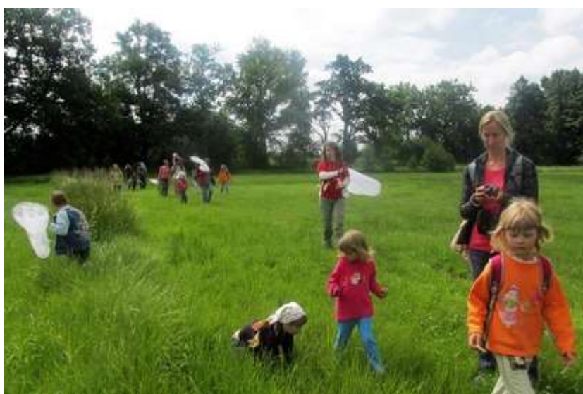
Za motýly na Vrbenské rybníky