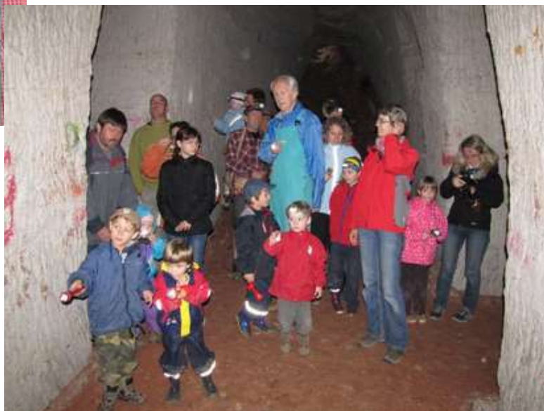
Výprava do Ortů