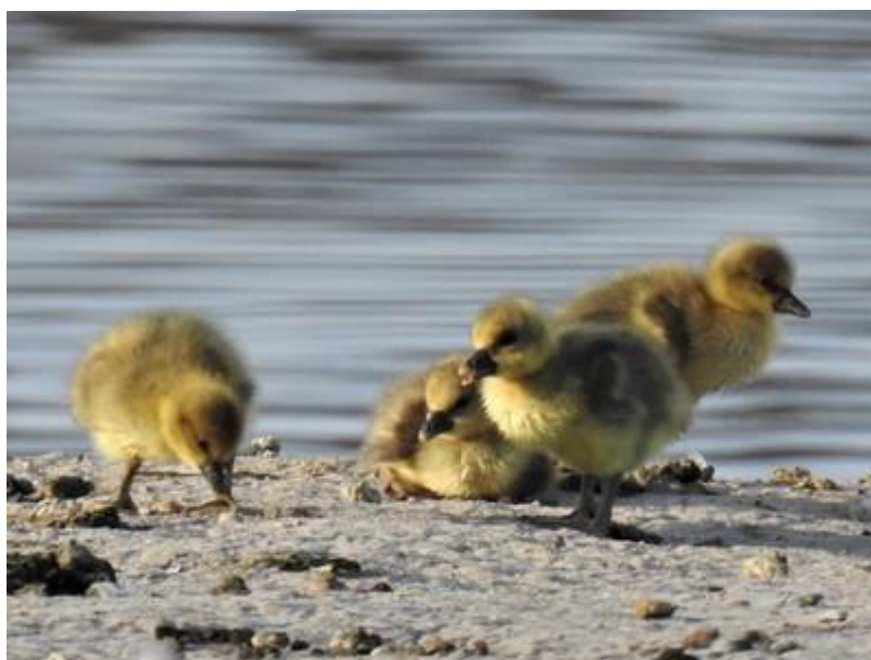
Housata husy velké