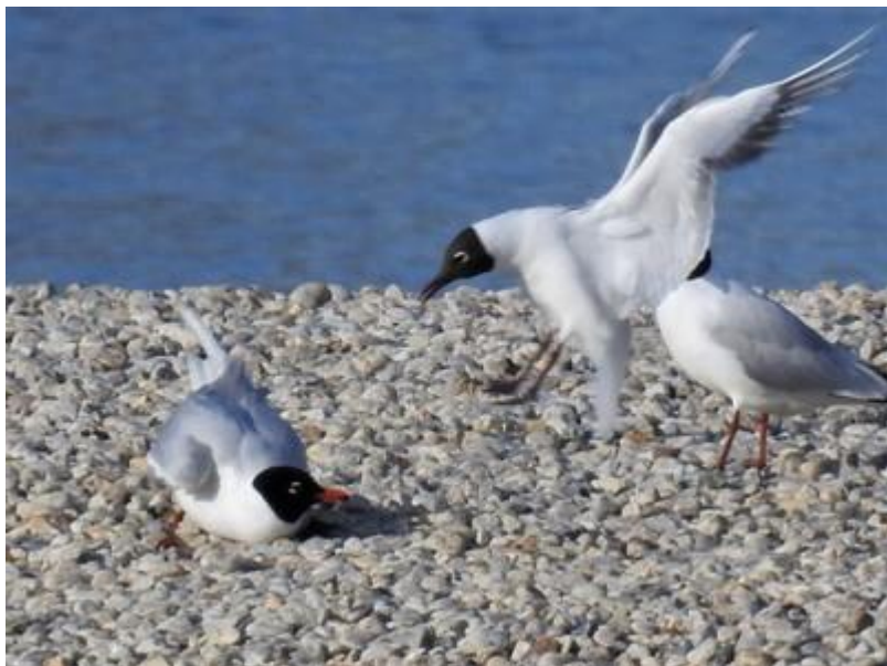
Racek černohlavý a rackové chechtaví