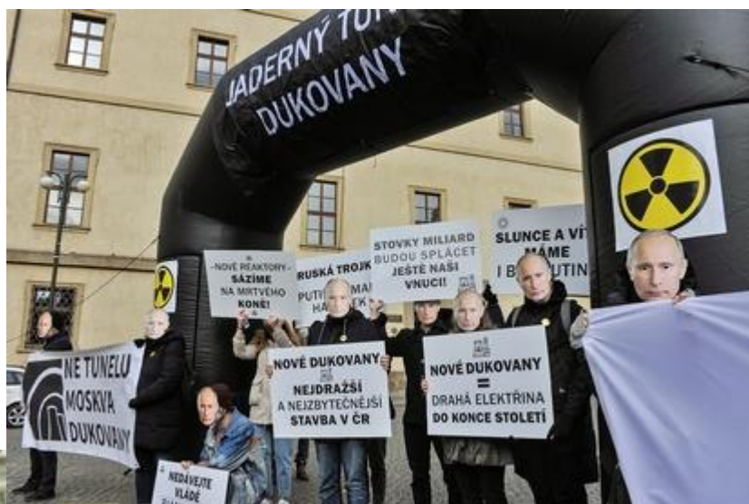
Happening proti Lex Dukovany