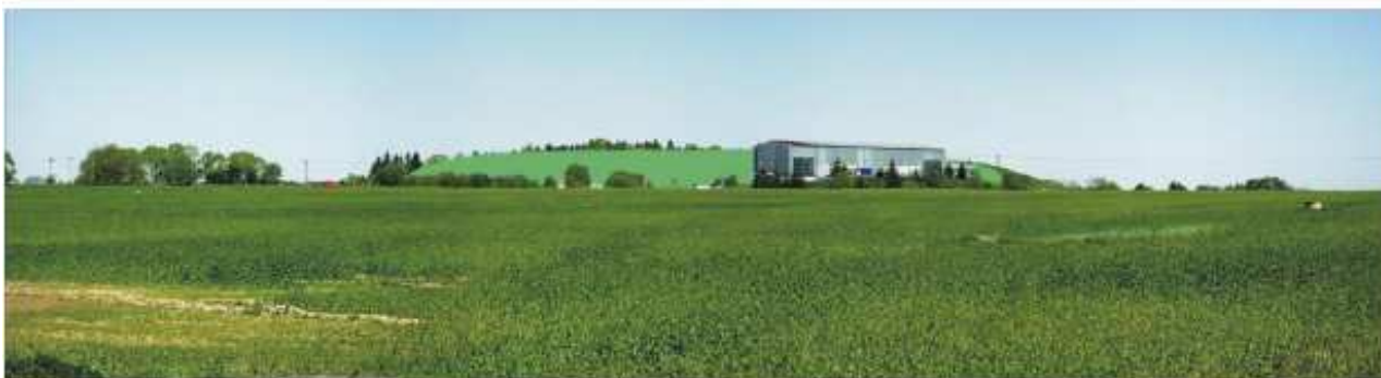
Tentýž pohled s vizuální simulací NS v panoramatu.