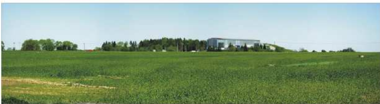
Pohled od silnice Lišov - Sosní.