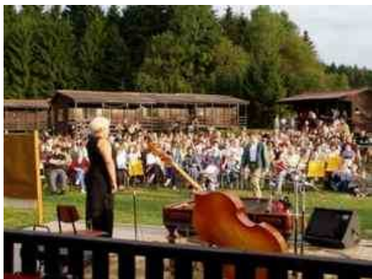
Foto: Před koncertem Hradišťanu v roce 2004.

„Oboroh je primitivní přístřeší na čtyřech kulech, kde najde zvěř v zimě potravu a člověk útočiště v čase nepohody,“ píše na webu o svém názvu skupina, která má pověst křesťanské (a ještě přesněji evangelické) folkrockové kapely. Její koncert v Růžené můžeme považovat za přístřeší pro všechny, kdo mají rádi dobrou muziku a současně chtějí dát najevo svůj vztah ke zdejší krajině.