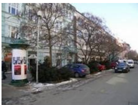
Obr.: Západní část Lannovky dříve