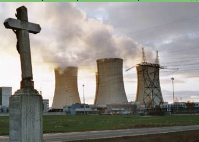
Dukovany: 1950 tun vysoceradioaktivního odpadu do roku 2025 (1) Temelín: 1800 tun vysoceradioaktivního odpadu do roku 2042 (2)

Jediným státem, který uvažuje o dovozu radioaktivních odpadů, je Rusko. Mimo uskladnění nabízí také možnost přepracování vyhořelého paliva. Česká republika tuto službu nevyužívá z důvodu vysoké ceny. Přepracovávat i skladovat vyhořelé jaderné palivo v Rusku navíc zvyšuje riziko pro životní prostředí. Nehody v uralském Čeljabinsku (závod na přepracování paliva Majak) vedly v minulosti k zamoření tisíců čtverečních kilometrů. Jiný ruský přepracovací závod Krasnojarsk-26 zase zamořil řeku Jenisej v délce pěti set kilometrů. Další alarmující kroky známe z minulosti: shazování sudů s radioaktivními odpady do moře či potopení desítek vysloužilých jaderných ponorek v Severním ledovém oceánu. Nelze si tedy dělat iluze o tom, jak by o naše vysoce nebezpečné odpady bylo postaráno. Také etické hledisko hovoří jasně – jaderný odpad zde vznikl kvůli našemu pohodlí a naší volbě využívat jadernou energetiku, proto bychom se o něj měli postarat sami.