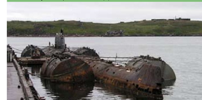
Poslední vlečná plavba do loděnice k likvidaci skončila katastrofou. Rezavá ponorka se potopila v Barentsově moři včetně 800 kg vyhořelého jaderného paliva.