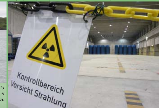
Sudy s jaderným odpadem, mezisklad Gorleben (6)