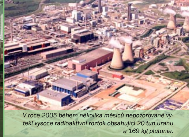
V roce 2005 během několika měsíců nepozorovaně vytekl vysoce radioaktivní roztok obsahující 20 tun uranu a 169 kg plutonia.