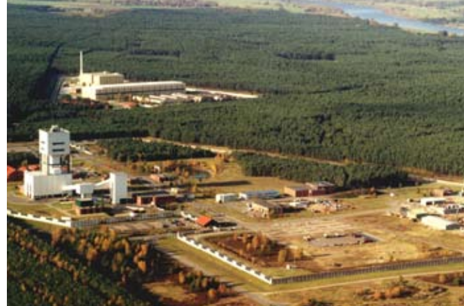
Areál úložiště v německém Gorleben (3)

Tato a mnohá další bezpečnostní hlediska musí platit po dobu stovek tisíc let. Problém s dodržением přísných bezpečnostních standardů může, stejně jako se to stalo v USA, vést ke změkčování zákonem stanovených požadavků na úložiště.