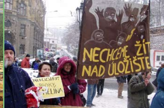
Demonstrace „Dejte přednost lidem“ před Úřadem vlády, leden 2004 (4)